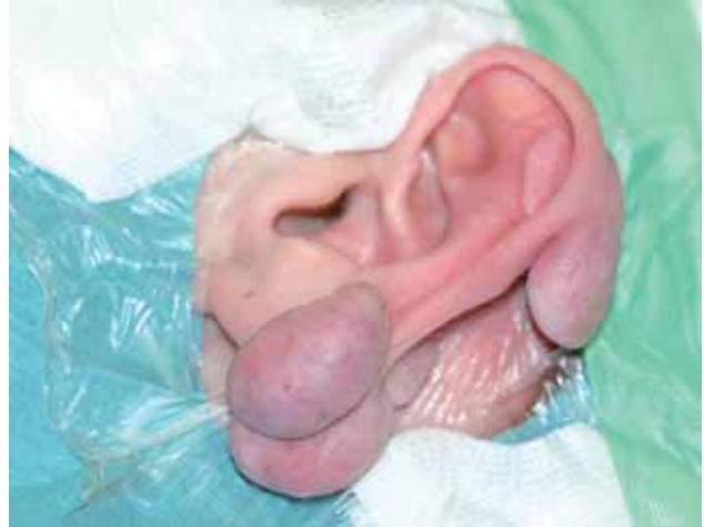
Fig. 9. Queloides múltiples en oreja producidos por peercing .