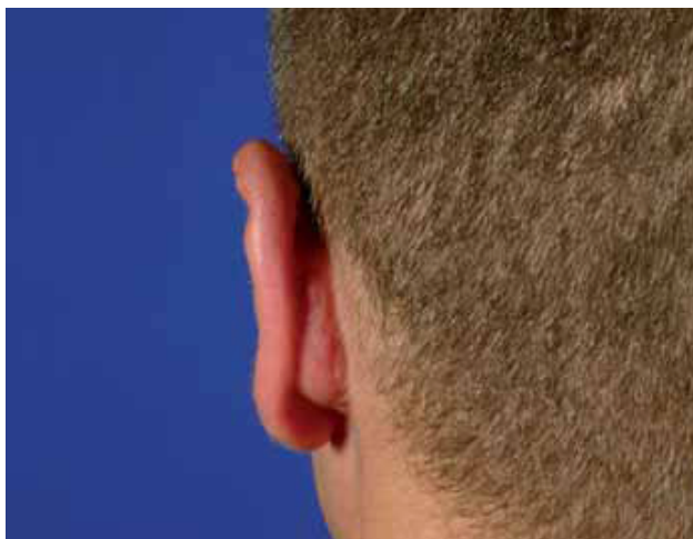
Fig. 8. Resultado al año del tratamiento. (Radioterapia externa).