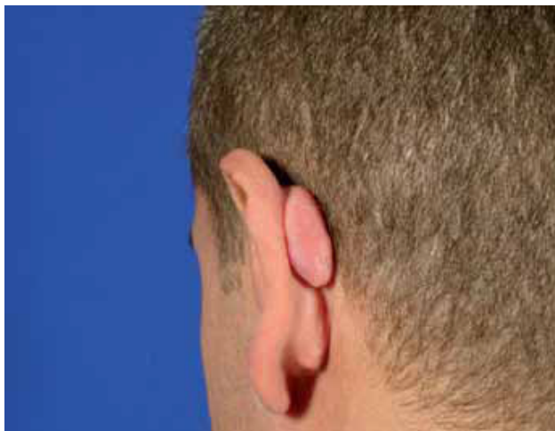
Fig. 6 y 7. Queloides retroauricular tras intervención de otoplastia.