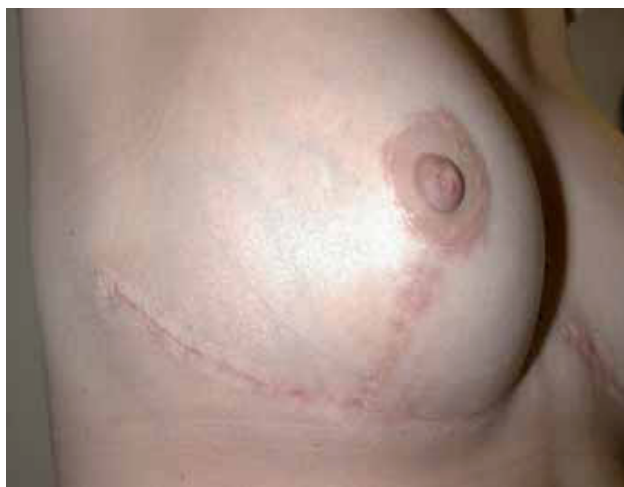
Fig. 5. Resultado a los 6 meses del tratamiento.

Entre las principales ventajas de esta técnica destacamos que la radiación empleada tiene muy corto alcance, por tanto irradia muy poca cantidad de tejido sano, con lo que la radioprotección del paciente es máxima. El principal inconveniente es la necesidad de llevar el catéter en la zona de la herida, por lo que no podrá usarse en casos muy extensos o complejos.