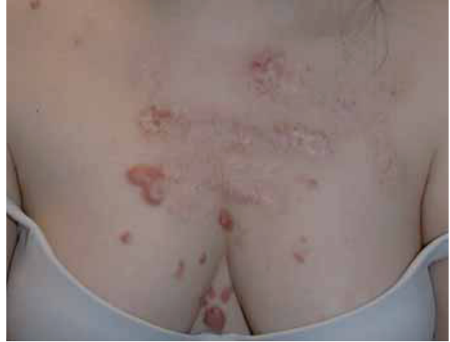
Fig. 14. Resultado tras un tratamiento en dos etapas (Radioterapia externa).

zación de esta zona, por pequeñas dehiscencias de sutura o retardo en el tiempo de curación. Las recidivas parciales, entendiéndose como tales aquellos queloides que han mejorado mucho pero que dejan como resultado el equivalente a una cicatriz hipertrofica, están alrededor del 14%. Las sensaciones de prurito, quemazón o hipersensibilidad desaparecieron en el 100% de los casos. Como efectos secundarios observamos telangiectasias en el 15,4% o cambios en la pigmentación cutánea en el 5,9%. Es frecuente a los pocos días de efectuado el tratamiento que se aprecie una discreta hiperpigmentación en la zona tratada que se resuelve sin mas tratamiento en las siguientes 6 a 12 semanas (Fig. 3-16).