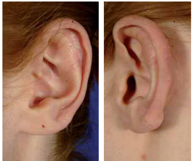
Fig. 11 y 12. Resultado tras 8 meses de tratamiento (Radioterapia externa).

de extensión plana puede aplicarse para su seguimiento la escala de Vancouver. Las recidivas totales, entendiéndose como tales la aparición de un queloides de tamaño similar al extirpado, con las dosis antes mencionadas, han estado por debajo del 4% de los casos, siendo la espalda la región que comprende la mayoría de estas recidivas. No hemos podido esta-