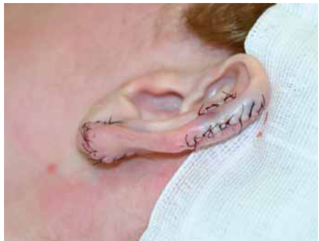
Fig. 10. Resultado tras exéresis y reconstrucción.