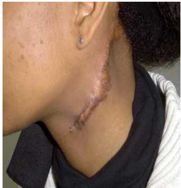
Fig. 16. Resultado al año de tratamiento (Braquiterapia).