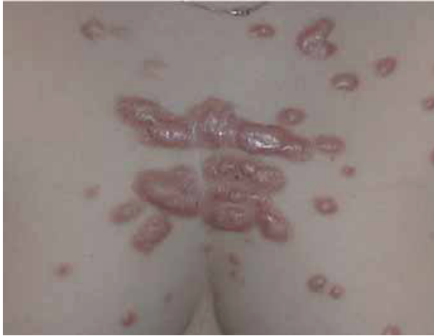
Fig. 13. Queloides múltiples en región esternal.