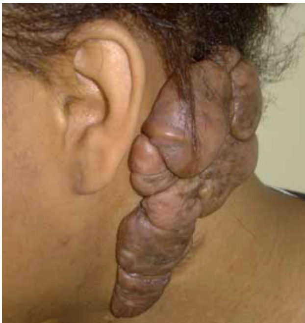
Fig. 15. Queloides de grandes dimensiones en la región retroauricular y submandibular.

La conveniencia de la radioterapia como tratamiento complementario a la cirugía de los queloides fue ampliamente demostrada por Borok y colaboradores (12). Ollstein (17) describió unas recidivas del 21 % en 68 queloides tratados mediante resección quirúrgica seguida de radioterapia. Kovalic (18) encontró un 27 % de recidivas tras un periodo mínimo de seguimiento de 2 años en 113 queloides tratados mediante cirugía y radioterapia. Bertiere (11) empleó la cirugía seguida de Iridio de baja tasa de dosis y describió un 13 % de recidivas en 46 queloides seguidos durante 10 meses. Clavere (13) encontró un 12 % de recidivas