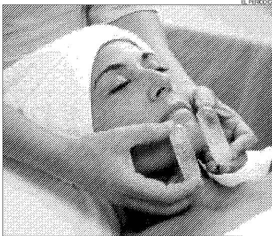
► Una mujer se somete a un tratamiento de estética facial.