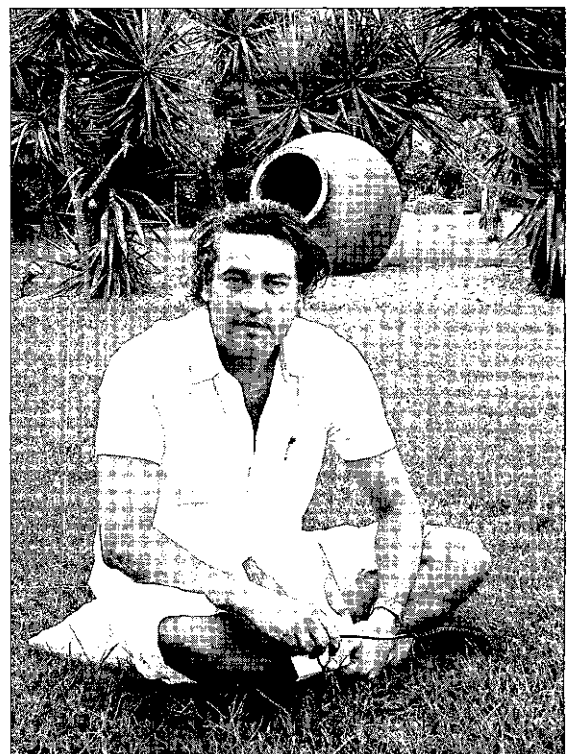
El cirujano catalán es un eminente profesional de la cirugía estética B. A.

«Los que nos dedicamos a esta especialidad somos reparadores de complejos. Yo mismo me operé de las orejas porque no soportaba que los compañeros de clase se rieran de ellas. Me llamaban Dumbo y me daba mucho apuro»