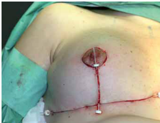
Fig. 4. Extirpación quirúrgica del queloides y colocación de un catéter bajo la sutura. (Braquiterapia).