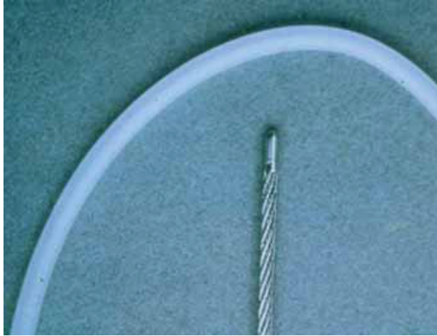
Fig. 1. Catéter para colocación subcutánea y fuente radiactiva Ir192.