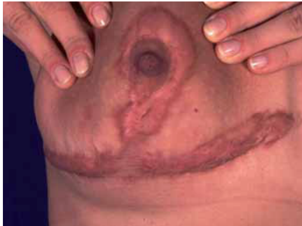
Fig. 3. Queloides en cicatrices de reducción mamaria. Puede verse su invasión a tejidos sanos.