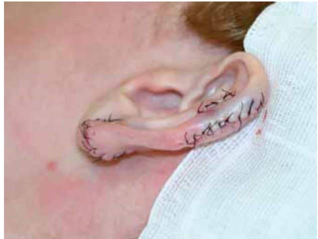
Fig. 10. Resultado tras exéresis y reconstrucción.